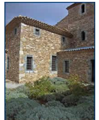
Cellule témoin entièrement reconstruite